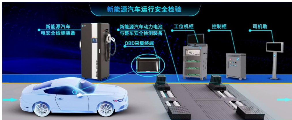
新能源汽车检验整体布局

公司联合中国汽研等头部公司，成立全国智能新能源汽车后市场行业产教融合共同体。与中国汽研达成战略合作，双方发挥各自优势，共建年检行业培训服务体系，开辟新能源汽车检验产教融合新模式。2023年在成都工业职业技术学院落地新能源汽车检验实训基地项目。